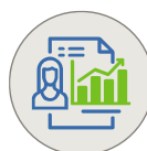
GESTIÓN DEL DESEMPEÑO