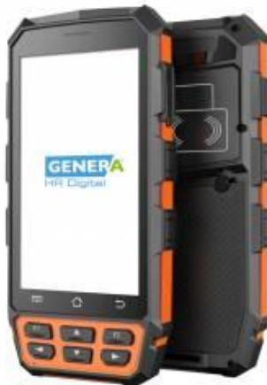
HAND HELD DE GENERA